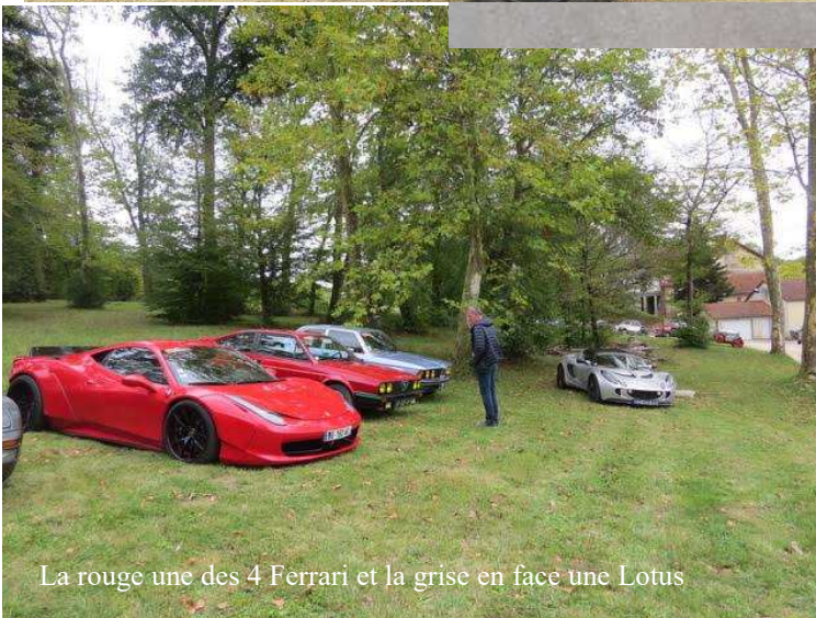
La rouge une des 4 Ferrari et la grise en face une Lotus