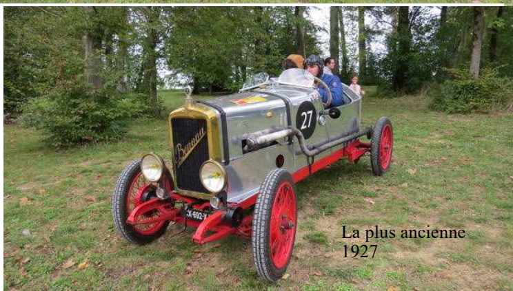
La plus ancienne 1927