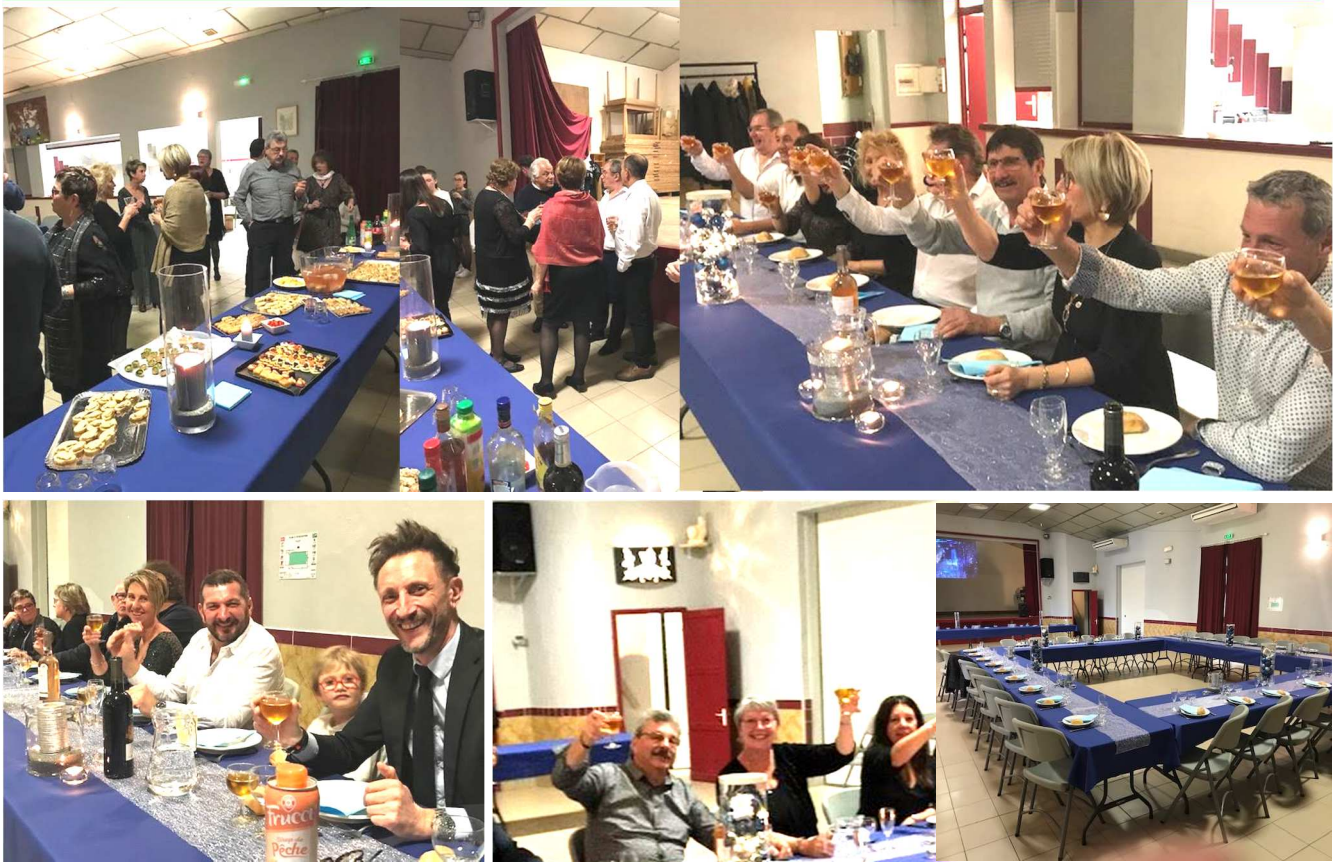
Un réveillon en petit comité . Une soirée très chaleureuse et conviviale pour passer en 2022.