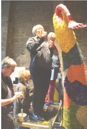
10/ Collage intensif des fleurs et pétales