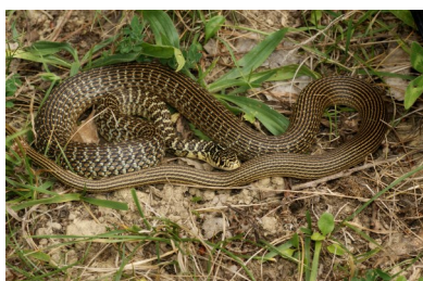
Couleuvre verte et jaune

A Saint-Mont, seulement 3 espèces sont connues sur les 5 observables dans le département du Gers : la couleuvre verte et jaune, la couleuvre helvétique (longtemps nommée couleuvre à collier) et la couleuvre vipérine. En élargissant un peu le périmètre, une espèce s'ajoute, la coronelle girondine, observée à Tasque. 4 couleuvres sur les 5 observables dans le département du Gers sont donc présentes sur notre territoire.