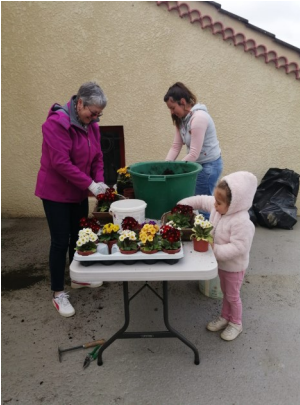
Plantation des primevères.

Comme chaque année, la fête du vin mobilise beaucoup de bénévoles avant, pendant et après la manifestation.