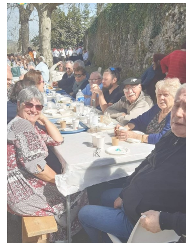
Le plein de soleil pour les touristes et les saint-montais!