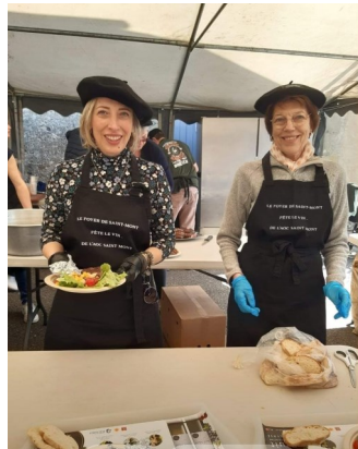
De nouvelles têtes!