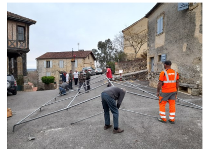
Montage des chapiteaux.

On est prêts, on vous attend de pied ferme!