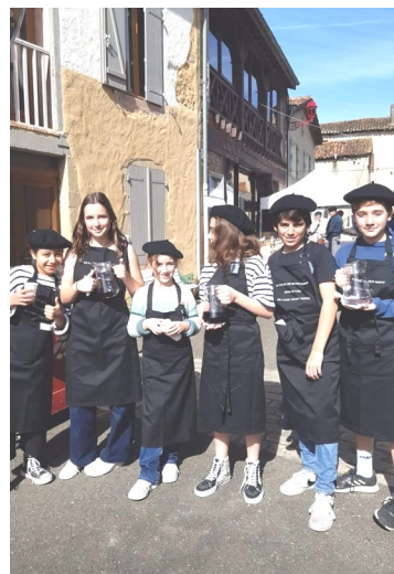
Une équipe dynamique au service.