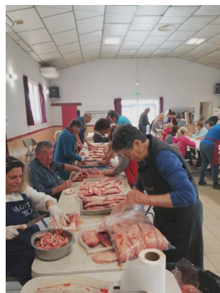
Préparation des magrets.