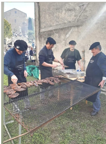
Nos experts grilleurs!

On est prêts, on vous attend de pied ferme!