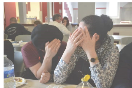
Ces deux là aimeraient bien passer incognito!