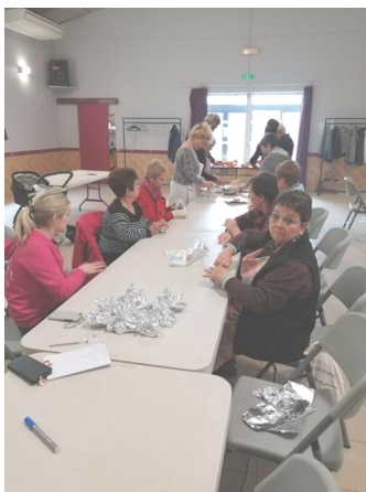
Préparation des papillotes.

Une édition réussie puisque tous les repas prévus ont été vendus!