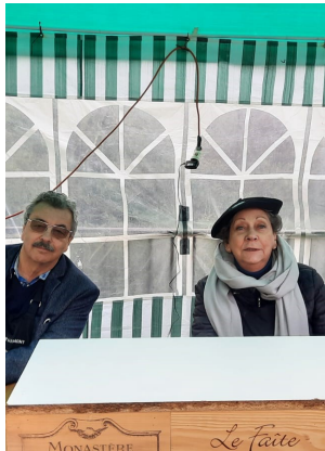
Des habitués Incontournables!