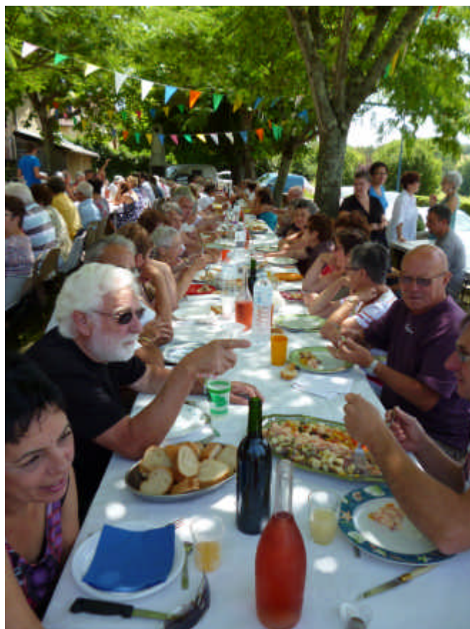
Souvenir de fête à Saint Mont

N'oubliez pas d'acheter votre carte du Foyer (10€ par an et par famille)